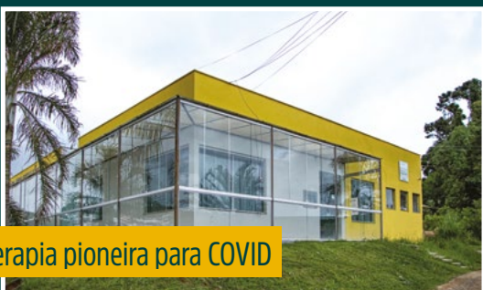
Terapia pioneira para COVID

Investimentos transformam a qualidade de ensino no município