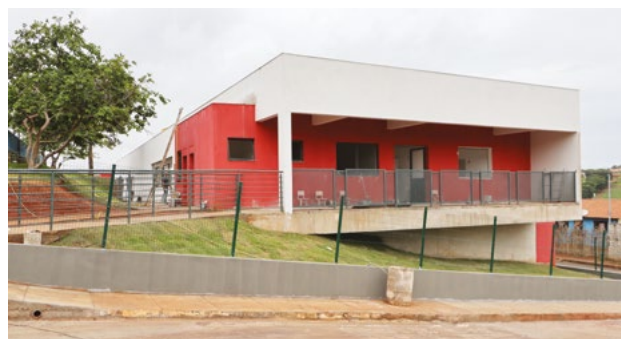
no bairro Fonte Verde

Construção de um novo Cmei que atenderá cerca de 200 crianças